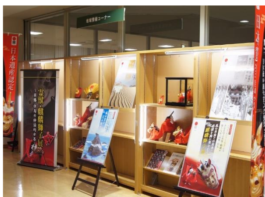
東口 展示例（麒麟獅子展）