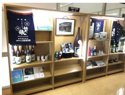
西口 展示例（鳥取県酒造組合）